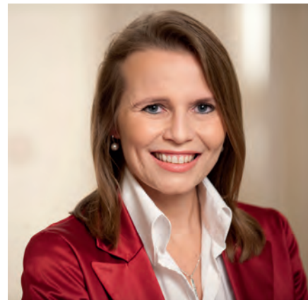
Dr. Beatrix Karl Bundesministerin für Wissenschaft und Forschung

Mit dem Statistischen Taschenbuch 2010 und dem Datawarehouse Hochschulbereich steht allen, die an Hochschul- und Forschungsfragen interessiert sind, eine reichhaltige Informationsquelle mit validen Daten und Fakten zur Verfügung. Ich freue mich, dass sich dieses Taschenbuch bei den AnwenderInnen großer Beliebtheit erfreut und danke jenen, die daran mitgearbeitet haben, für ihr Engagement.